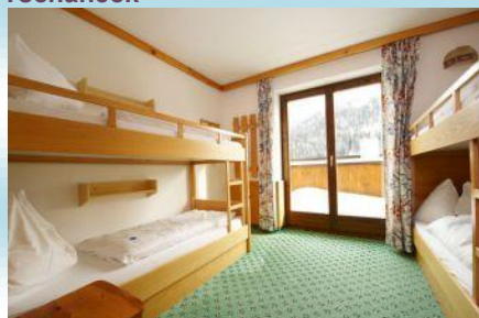
Poschodové posteľe Kareck I / II.