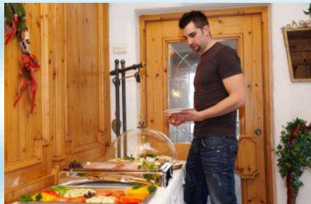
Bohaté raňajky formou bufetu